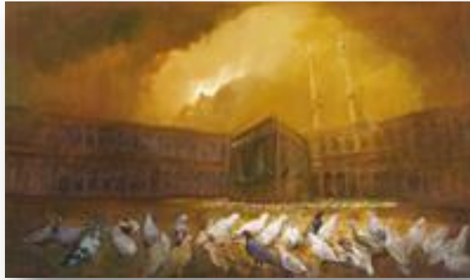
(لوحة الفنان محمد عايش، 1427هـ، زيت على قماش 2,180×105,5سم، شكل 1)