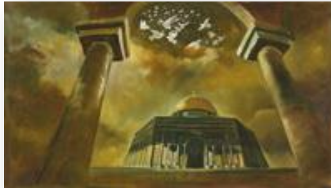
(لوحة الفنان محمد عايش، 1427هـ، زيت على قماش 180,2×105,5سم، شكل 3)