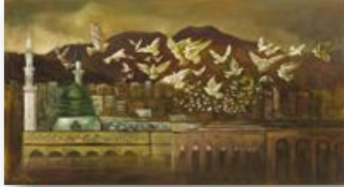
(لوحة الفنان محمد عايش، 1427هـ، زيت على قماش 180,2×105,5سم، شكل 2)