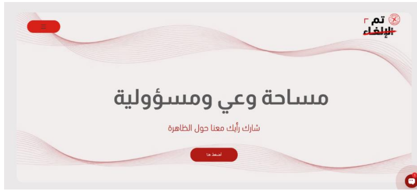
شكل 1. واجهة التفاعل الرئيسية لمنصة الإلغاء

في ضوء نتائج البحث وآراء الخبراء، تم تطوير نموذج إعلامي رقمي مقترح في صورة منصة إلكترونية توعوية بعنوان «تم الإلغاء»، وهي منصة تستهدف تعزيز الوعي بثقافة الإلغاء وأثارها على السمعة العامة للأفراد والمؤسسات. وقد صُممت المنصة بوصفها بيئة إعلامية رقمية تجمع بين المحتوى المعرفي، والتحليل الإعلامي، والسرد القصصي، والتفاعل الجماهيري، بما يساعد المستخدم على فهم الظاهرة والتمييز بين النقد البناء والمحاسبة الأخلاقية من جهة، والملاحقة الرقمية أو الإلغاء غير العادل من جهة أخرى. ويوضح الشكل (1) واجهة التفاعل الرئيسية لمنصة الإلغاء.