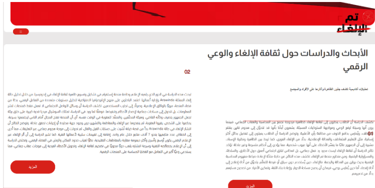
شكل 9. قسم التوعوية

وبناءً على ذلك، يمكن النظر إلى منصة «تم الإلغاء» بوصفها نموذجًا إعلاميًا توعويًا يقوم على خمسة مكونات رئيسية: المكون المعرفي، من خلال المقالات والتعريفات؛ والمكون التحليلي، من خلال دراسة الحالات والنماذج؛ والمكون الإنساني، من خلال القصص والتجارب؛ والمكون التفاعلي، من خلال النقاشات وآراء الجمهور؛ والمكون الوقائي، من خلال أدوات التوعية والتحقق والتقييم. وتتكامل هذه المكونات في دعم الهدف الرئيس للنموذج، وهو تعزيز الوعي بثقافة الإلغاء والحد من أثارها السلبية على السمعة العامة.