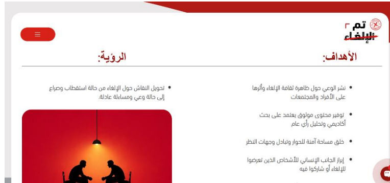
شكل 3. قسم رؤيتنا

أما قسم «رؤيتنا» فيعرض التوجه العام للمنصة، والذي يتمثل في تحويل النقاش حول ثقافة الإلغاء من حالة الاستقطاب والصراع إلى حالة من الوعي والمساءلة العادلة، إضافة إلى نشر الوعي بالظاهرة، وتوفير محتوى موثوق، وخلق مساحة آمنة للحوار وتبادل وجهات النظر. ويوضح الشكل (3) قسم رؤيتنا.