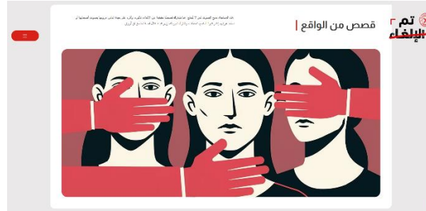
شكل 6. قسم القصص

أما قسم «القصص» فيمثل البعد الإنساني في النموذج المقترح؛ إذ يعرض قصصًا واقعية أو محاكاة قصصية توضح أثر الإلغاء على حياة الأفراد، مثل فقدان العمل، أو التحول إلى قضية رأي عام، أو الانسحاب من الفضاء الرقمي نتيجة الضغط الجماعي. ويدعم هذا القسم هدف المنصة في إبراز البعد الإنساني والنفسي لتقافة الإلغاء، وعدم اختزال الظاهرة في كونها مجرد تفاعل رقمي عابر. وشكل (6) يوضح قسم القصص.