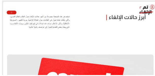
شكل (5). قسم أبرز حالات الإلغاء

ويشتمل النموذج كذلك على قسم «أبرز حالات الإلغاء»، الذي يعرض نماذج عربية وأجنبية لحالات ارتبطت بالإلغاء الرقمي، مع توضيح السياقات التي أدت إلى تصاعدها وتحولها إلى أزمات سمعة أو قضايا رأي عام. وتكمن أهمية هذا القسم في أنه يقدم للمتلقى أمثلة تطبيقية تساعد على فهم آليات تشكل موجات الإلغاء، ودور الإعلام الرقمي والجمهور في تضخيمها، والآثار المهنية والاجتماعية التي قد تترتب عليها. وشكل (5) يوضح قسم أبرز حالات الإلغاء