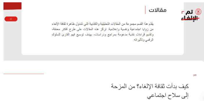
شكل (4). قسم المقالات

كما يتضمن النموذج قسماً للمقالات التحليلية، يعرض موضوعات تتناول نشأة ثقافة الإلغاء، وحدودها بين العدالة الرقمية والتنمر الجماعي، وتأثيراتها النفسية والاجتماعية، وعلاقتها بالصحة النفسية. ويُعد هذا القسم مكوناً معرفياً وتحليلياً داخل المنصة، لأنه يساعد المستخدم على الانتقال من الفهم السطحي للظاهرة إلى إدراك أبعادها المركبة، وما تتضمنه من توتر بين حرية التعبير، والمحاسبة الاجتماعية، وحماية السمعة. وشكل (4) يوضح قسم المقالات.